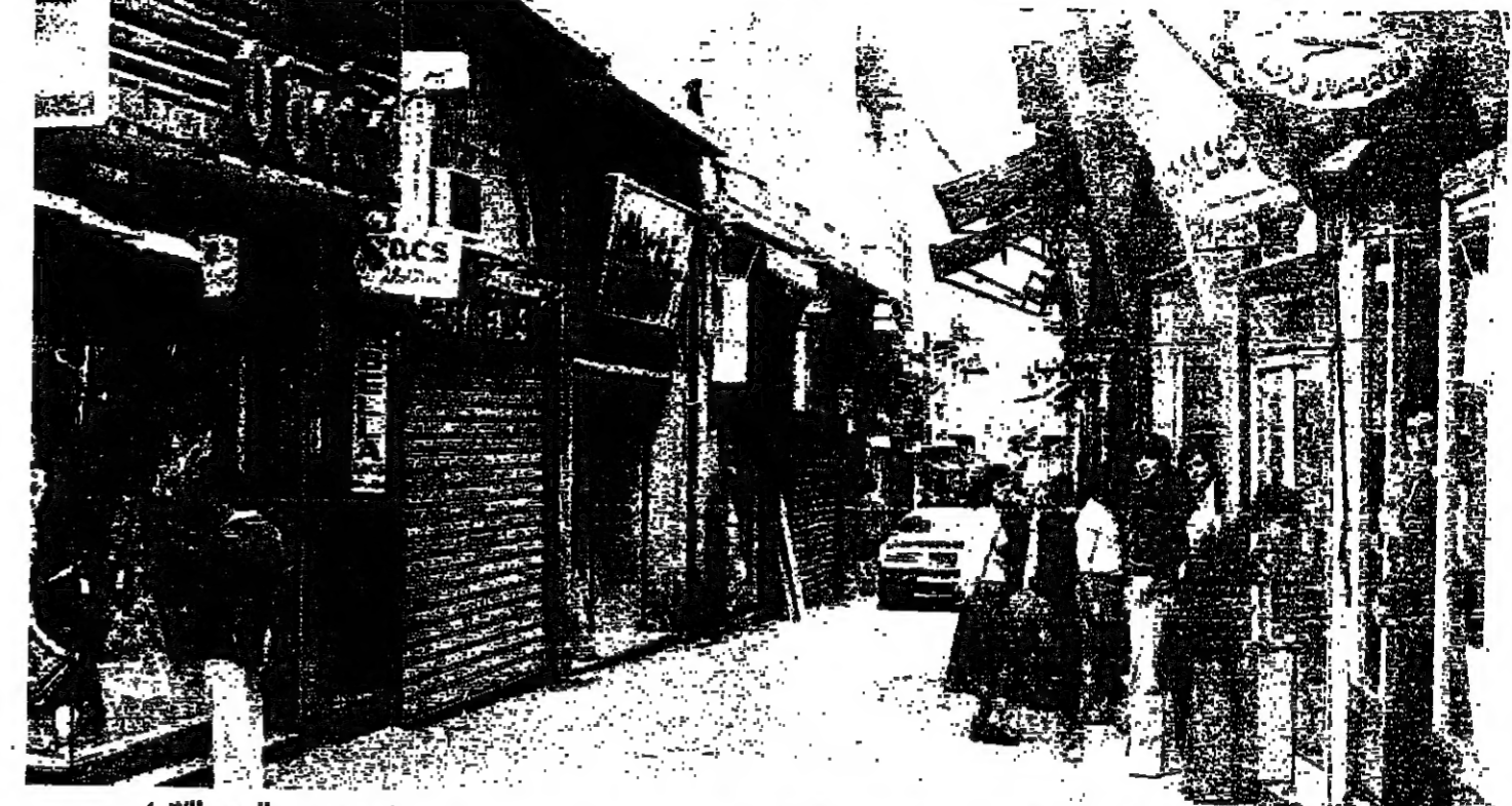
تنتج المحلات في اسواق بيروت كان جزيا ..